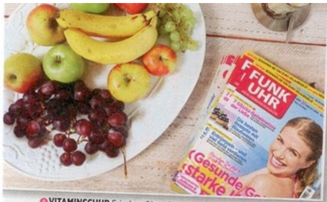
VITAMINSCHUB Frisches Obst, Brötchen, Leckereien und die FUNK UHR zum Blättern – damit wurden unsere Titelstars im Fotostudio verwöhnt